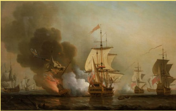
Skilderij fan de de ûntploffende de San José. Troch Samuel Scott - Publiek domein

Wy begjinne diskear yn it Karaïbysk gebiet, mei in ferhaal dat in bytsje liket op de film Pirates of the Caribbean . Op 8 juny 1708 wie der in gefjocht tusken Britske en Spaanske skippen foar de kust fan Colombia. Ien fan de Spaanske skippen eksplodearre en sonk. Oan board fan it skip, de San José, wie foar in kapitaal oan goud, servysguod en dat soarte fan dingen. Der wurdt rûze dat it wolris om 17 miljard euro gean kin. Net raar dat de autoriteiten fan Colombia it skip mei ynhâld graach boppe wetter helje wolle. Mooglik sil dat dizze maitiid barre. Jacht op in gigantyske goudskat!