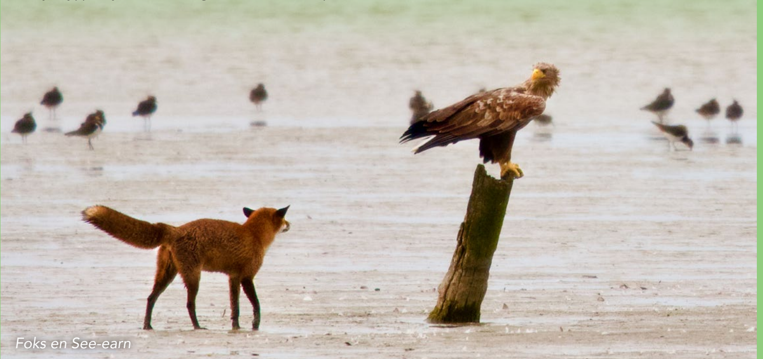
Foks en See-earn

Plestik komt oeral yn werom. Ek yn jierdeikado's. 'Do kinst der noait hielendal omhinne, mar wy besykje der wol om te tinken. As ien fan ús jierdei is, dan krije wy in belevenis, yn plak fan noch mear guod. We gean dan byfoarbyld mei ús allen wat leuks dwaan. Ik mocht al ris op paad mei in bekende natuerfotograaf en haw in workshop oer rôffûgels folge.' Foar syn kommende jierdei hat Pelle ek al in goed kado yn gedachten: in drone. 'It is net hiel goedkeap (en ek net plestikfrij), mar it past goed by myn grutte dream om natuerfotograaf te wurden. Ik wol noch tichteby de fûgels komme en se sa moai mooglik fêstlizze.'