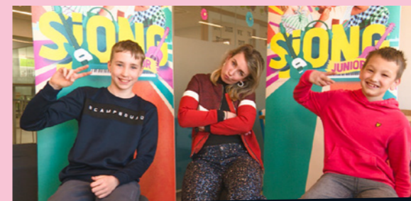
Dr. J. Botkeskoalle - Damwâld