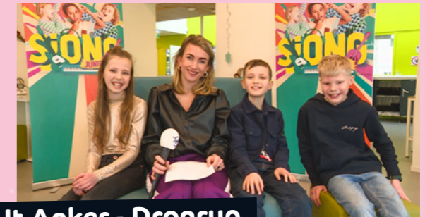
It Anker - Dronryp