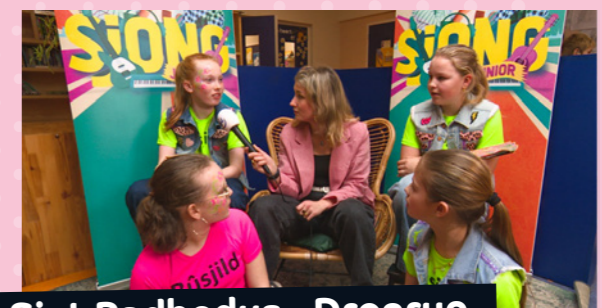
Sint Radbodus - Dronryp

Niek (links): 'No, ús groep 7/8 is net sa grut, en dan binne je net sa lûd op it poadium. Dus dan is it wol moai dat groep 6 derby komt. We brûke se as in soad koar, foar mear lûd op it poadium.'